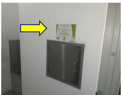
DUCTO DE BASURA.

El condominio brinda la facilidad de un cuarto de aseo común por piso, este se encuentra ubicado en el costado sur, escaleras de emergencia. Este cuarto es para depositar todos los desechos (basura) no valorizables .