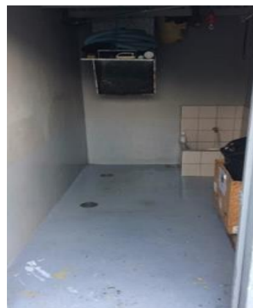
CUARTO DE BASURA

No provoque atascos al ducto de basura por uso inadecuado.